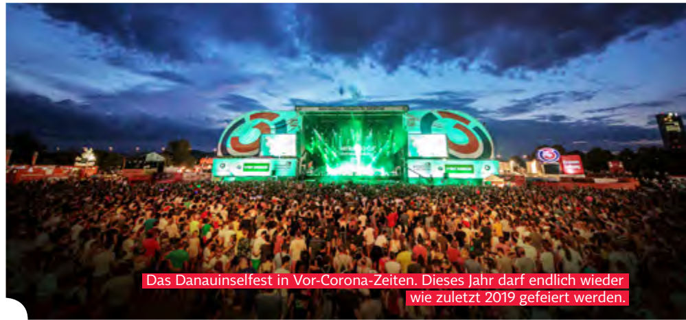
Das Danauinselfest in Vor-Corona-Zeiten. Dieses Jahr darf endlich wieder wie zuletzt 2019 gefeiert werden.