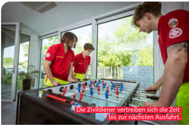
Die Zivildienstler vertreiben sich die Zeit bis zur nächsten Ausfahrt.