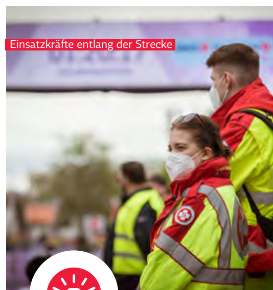
Einsatzkräfte entlang der Strecke