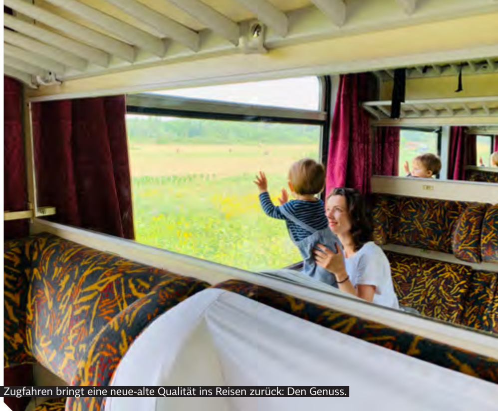
Zugfahren bringt eine neue-alte Qualität ins Reisen zurück: Den Genuss.

Es ist nicht mehr so, dass der höchste Genuss darin liegt, das billigste Schnäppchen für einen Flug zu ergattern, um da irgendwo weit weg in einem Club zu sitzen, mit lauter anderen Menschen aus dem eigenen Land. Da verändert sich generell was. Und das spüren wir und kommt uns auch zu gute. Nach Hanoi kannst du schon um 700 Euro fahren. Und das ist einfach eine spannende Weltreise.