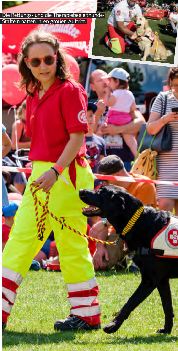
Die Rettungs- und die Therapiebegleithunde-Staffeln hatten ihren großen Auftritt.