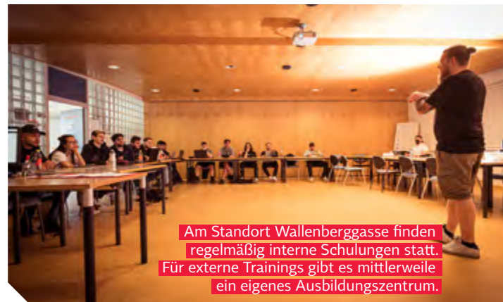
Am Standort Wallenberggasse finden regelmäßig interne Schulungen statt. Für externe Trainings gibt es mittlerweile ein eigenes Ausbildungszentrum.

Was waren in den letzten Jahren besondere Herausforderungen? Da kommt die Sprache natürlich sofort auf „Corona“. Ein Aspekt, der laut Scheidl bei diesem Thema gern vergessen wird: Die Pandemie hatte auch große Auswirkungen auf das Ehrenamt. „Über die Wochen und Monate des Social Distancings gingen uns einige Freiwillige verloren – die wollen wir jetzt wieder zurückgewinnen!“ Eine Zäsur war auch das Feuer in der Fuhrpark-Garage vor etwas mehr als 10 Jahren. Bis auf die zwei Autos, die in der Unglücksnacht zufällig unterwegs waren, wurden alle Fahrzeuge beschädigt. Der Umgang mit dieser