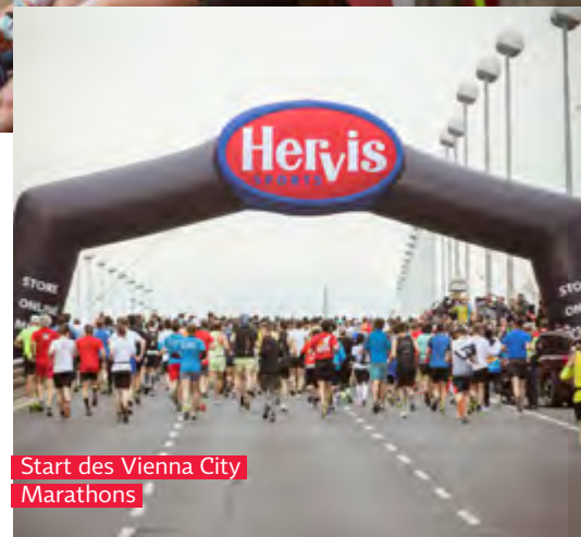
Start des Vienna City Marathons