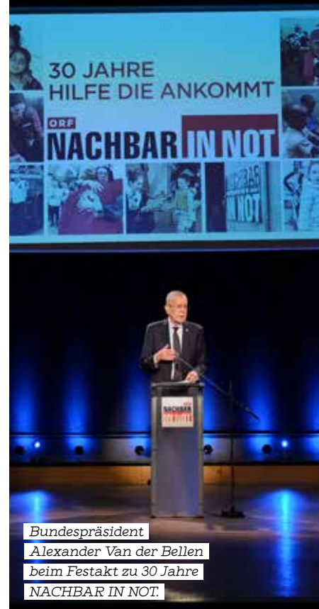
Bundespräsident Alexander Van der Bellen beim Festakt zu 30 Jahre NACHBAR IN NOT.

Anlässlich des runden Jubiläums fand am 11. November 2022 auch ein Festakt im ORF RadioKulturhaus in Wien statt. Bundespräsident Alexander Van der Bellen, Vizekanzler Werner Kogler, Bundesministerin Alma Zadić und hochrangige Vertreter*innen des ORF und der NACHBAR IN NOT-Hilfsorganisationen