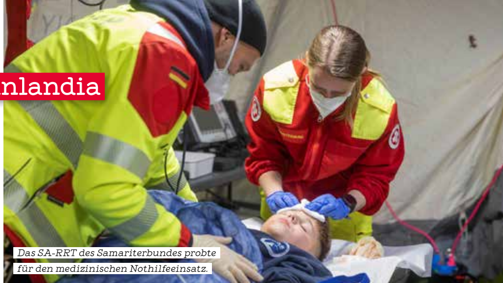
Das SA-RRT des Samariterbundes probte für den medizinischen Nothilfeinsatz.

E in schweres, aber fiktives Erdbeben erschütterte die Zentralregion „Wesel“ im Land Rheinlandia. Das Epizentrum lag in Hünxe in elf Kilometer Tiefe und war auch in den Nachbarländern zu spüren. Infolge des Bebens war das Gesundheitssystem im Katastrophengebiet nicht mehr funktionsfähig. Um die medizinische Versorgung weiterhin gewährleisten zu können, entschloss sich die Regierung von Rheinlandia, um internationale Hilfe anzusuchen. Fünf WHO-zertifizierte medizinische Notfallteams wurden daher in das Einsatzgebiet entsandt. So das Übungsszenario der diesjährigen „Joint German EMT Exercise 2022 Hünxe/Germany“ in Deutschland. Fünf Tage probten Emergency Medical Teams (EMTs) unterschiedlicher Organisationen den internationalen medizinischen