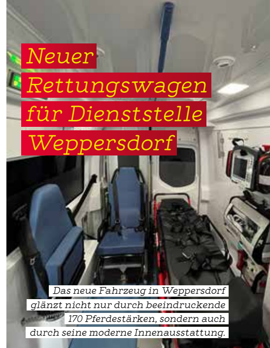
Das neue Fahrzeug in Weppersdorf glänzt nicht nur durch beeindruckende 170 Pferdestärken, sondern auch durch seine moderne Innenausstattung.