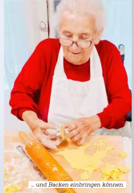
... und Backen einbringen können.

Dieser Tage verwandeln sich die Samariterbund-Pflegeeinrichtungen wieder zu kleinen Weihnachtswerkstätten. Bastelecken, Backstationen und Nähstübchen wurden eingerichtet. Hier spürt man, Weihnachten ist nicht mehr weit.