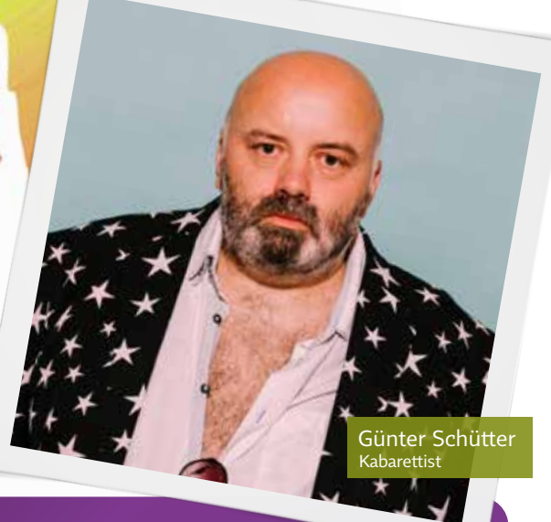
Günter Schütter Kabarettist