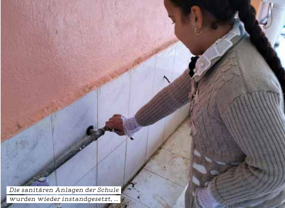
Die sanitären Anlagen der Schule wurden wieder instandgesetzt, ...