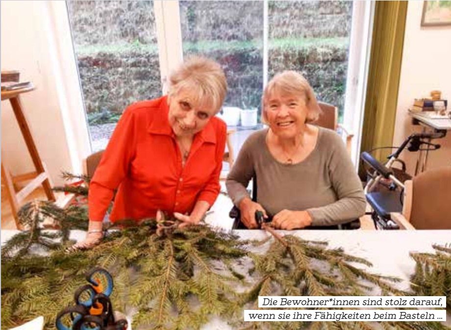
Die Bewohner*innen sind stolz darauf, wenn sie ihre Fähigkeiten beim Basteln ...