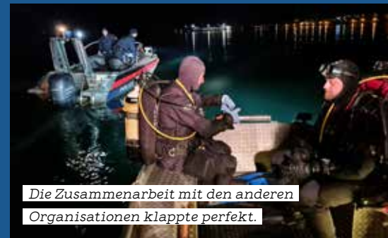
Die Zusammenarbeit mit den anderen Organisationen klappte perfekt.