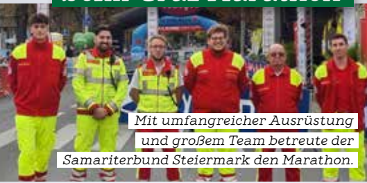
Mit umfangreicher Ausrüstung und großem Team betreute der Samariterbund Steiermark den Marathon.

Ein Jahr nach dem erfolgreichen Auftakt betreute der Samariterbund Steiermark auch heuer wieder den Graz Marathon. Bei der 29. Ausgabe der größten Laufsportveranstaltung des Landes war der Samariterbund mit sechs Rettungsfahrzeugen, einem Notarzt-Einsatzfahrzeug, einer mobilen Leitstelle, einem Ambulanzzelt, zwei Notärzt*innen und insgesamt 28 Samariter*innen im Einsatz.