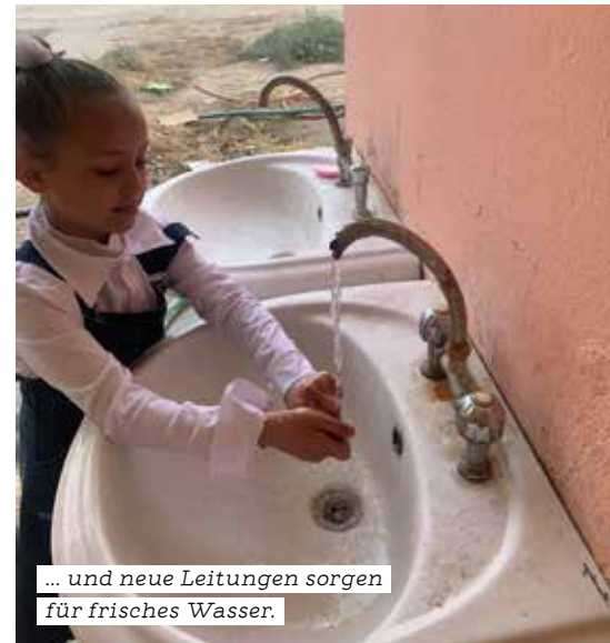
... und neue Leitungen sorgen für frisches Wasser.

terricht, sowie ebenso viele Mädchen zwischen 12 und 15 Jahren aus dem Nachmittagsunterricht sollen von den Verbesserungen profitieren.