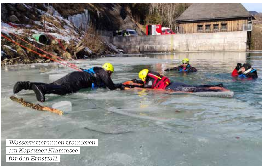
Wasserretter:innen trainieren am Kapruner Klammsee für den Ernstfall.