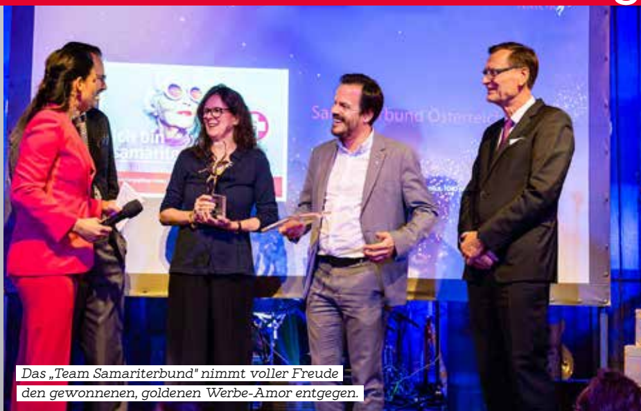
Das „Team Samariterbund“ nimmt voller Freude den gewonnenen, goldenen Werbe-Amor entgegen.

Im feierlichen Rahmen von Toni Mörwalds „Palazzo“-Dinnershow wurde zum 29. Mal der Kurier Werbe-Amor 2022 in Gold, Silber und Bronze verliehen. Unser Team konnte es kaum glauben, als das Siegersujet verkündet wurde. Voller Stolz wurde der Preis entgegengenommen.