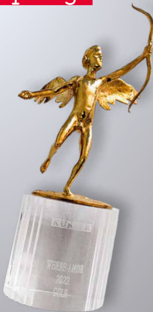
Und so sieht er aus, der gewonnen Werbe-Amor in Gold.