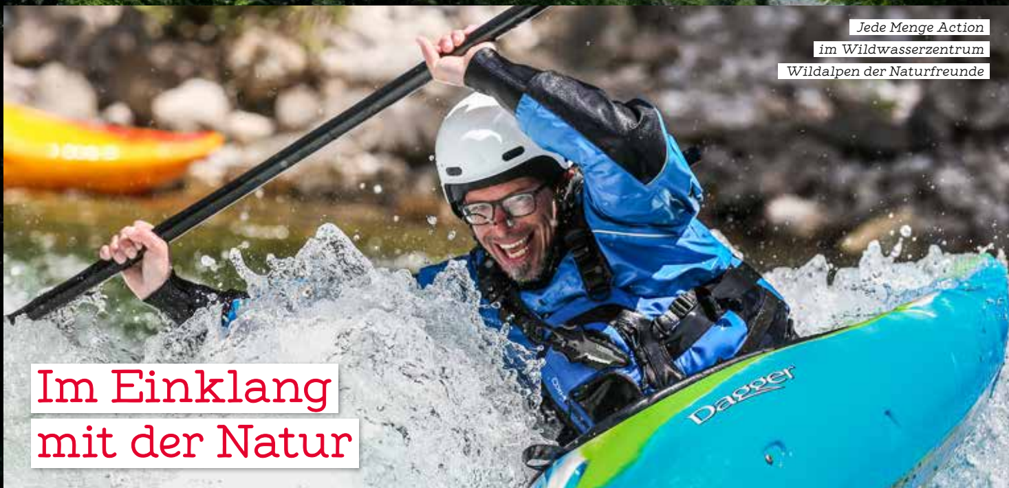
Jede Menge Action im Wildwasserzentrum Wildalpen der Naturfreunde