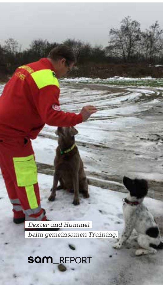
Dexter und Hummel beim gemeinsamen Training.