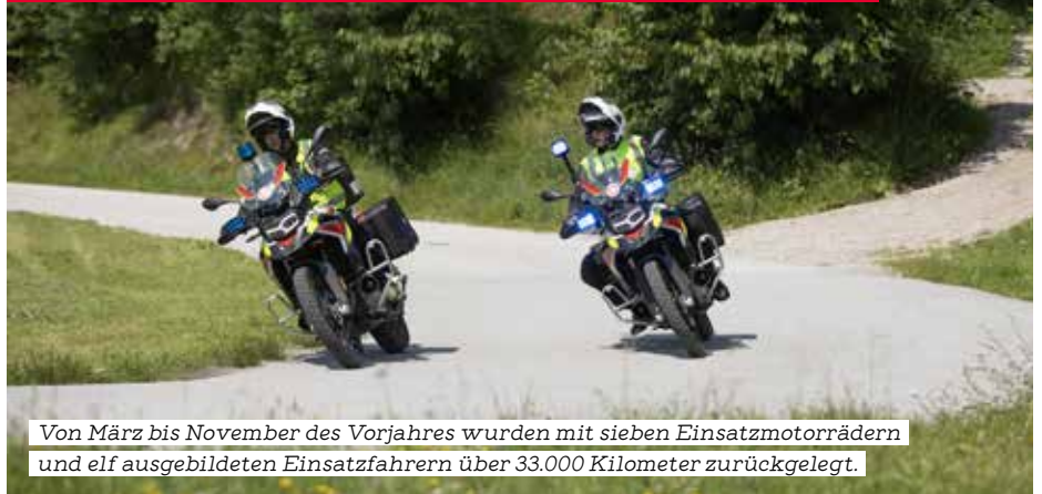
Von März bis November des Vorjahres wurden mit sieben Einsatzmotorrädern und elf ausgebildeten Einsatzfahrern über 33.000 Kilometer zurückgelegt.