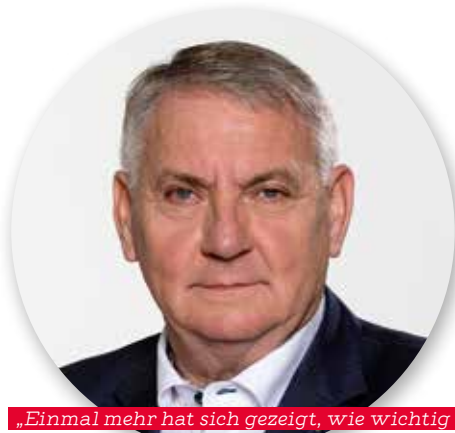
„Einmal mehr hat sich gezeigt, wie wichtig grenzüberschreitende Hilfe und Solidarität sind und dass auf den Samariterbund immer Verlass ist.“