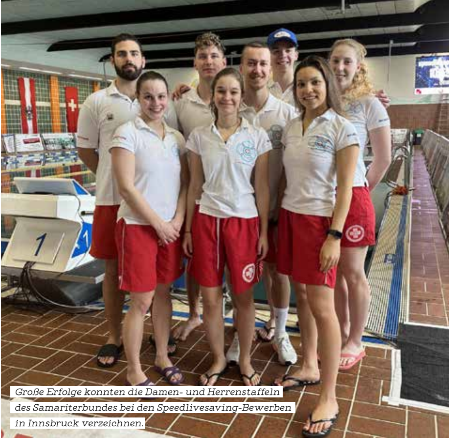
Große Erfolge konnten die Damen- und Herrenstaffeln des Samariterbundes bei den Speedlivesaving-Bewerben in Innsbruck verzeichnen.