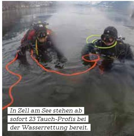
In Zell am See stehen ab sofort 23 Tauch-Profis bei der Wasserrettung bereit.

In Zell am See wurde darüber hinaus die einwöchige Ausbildung für Eistaucher:innen (nach TÜV zertifizierten Standards) abgeschlossen. Damit stehen ebendort insgesamt 23 Taucher:innen bereit, der Großteil von ihnen wurde für alle Einsatzszenarien im Sommer und Winter ausgebildet und trainiert. ●