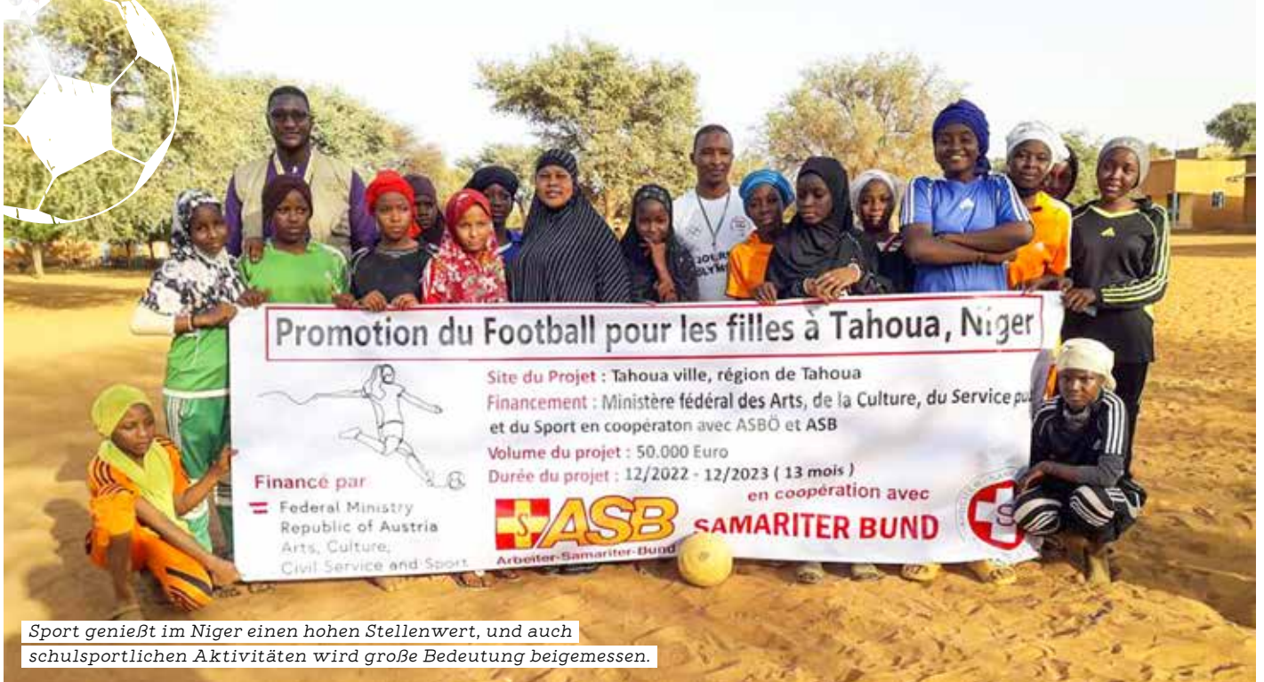
Sport genießt im Niger einen hohen Stellenwert, und auch schulsportlichen Aktivitäten wird große Bedeutung beigemessen.