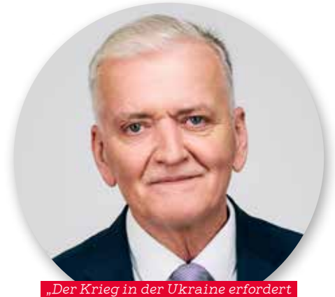
„Der Krieg in der Ukraine erfordert unsere Solidarität und Hilfe.“

Es werde „Hilfe auf drei Ebenen“ geleistet, so Schnabl: „Da ist zunächst einmal die Hilfe vor Ort, in Kooperation mit ‚Nachbar in Not‘ und gemeinsam mit lokalen Partnern wie etwa dem Länderbüro Ukraine des deutschen Samariterbundes und dem HADC (Humanitarian Aid and Development Centre). In Öster-