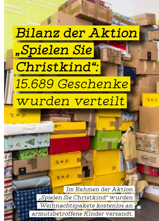
Im Rahmen der Aktion „Spielen Sie Christkind“ wurden Weihnachtspakete kostenlos an armutsbetroffene Kinder versandt.

B ereits zum zehnten Mal fand heuer die Aktion „Spielen Sie Christkind“ von Samariterbund und der Österreichischen Post statt, bei der kostenlos Weihnachtspakete an armutsbetroffene Kinder verschickt werden konnten. Dieses Jahr wurden 15.689 Geschenke abgegeben.