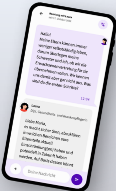
Die Berater:innen kennen die Sorgen der oft überforderten Angehörigen und stehen ihnen mit Rat und Tat zur Seite.