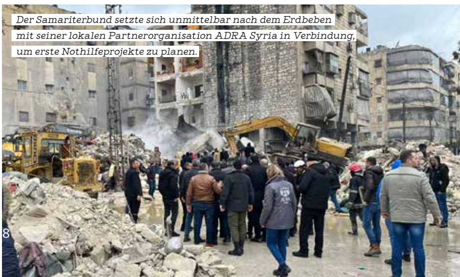
Der Samariterbund setzte sich unmittelbar nach dem Erdbeben mit seiner lokalen Partnerorganisation ADRA Syria in Verbindung, um erste Nothilfprojekte zu planen.

Alle Aktivitäten von Samariterbund und ADRA Syria befinden sich in engmaschiger Abstimmung mit den Behörden von Aleppo und Latakia, sei es auf Regierungsebene wie auch auf Seiten der Infrastruktur. Weitere Soforthilfemaßnahmen für die Bevölkerung in Aleppo, Latakia und Hama – Nahrungsmittel und Sachgüter betreffend – sind in Planung.