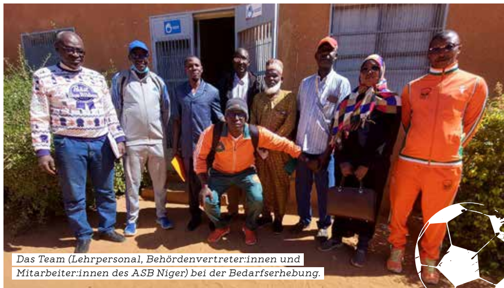
Das Team (Lehrpersonal, Behördenvertreter:innen und Mitarbeiter:innen des ASB Niger) bei der Bedarfserhebung.