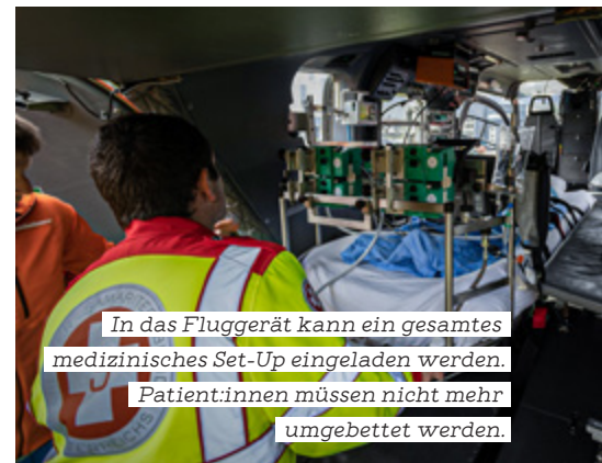
In das Fluggerät kann ein gesamtes medizinisches Set-Up eingeladen werden. Patient:innen müssen nicht mehr umgebettet werden.

verwundeter junger Ukrainer, dem ein Bein amputiert werden musste, von der Slowakei nach Österreich geflogen, wo er weiter intensivmedizinisch behandelt wurde.