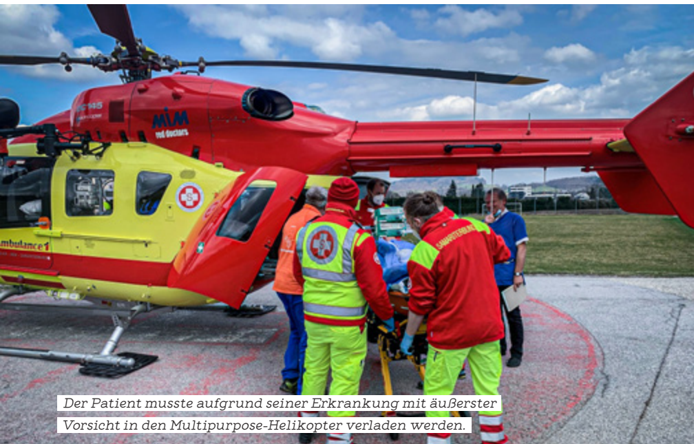
Der Patient musste aufgrund seiner Erkrankung mit äußerster Vorsicht in den Multipurpose-Helikopter verladen werden.