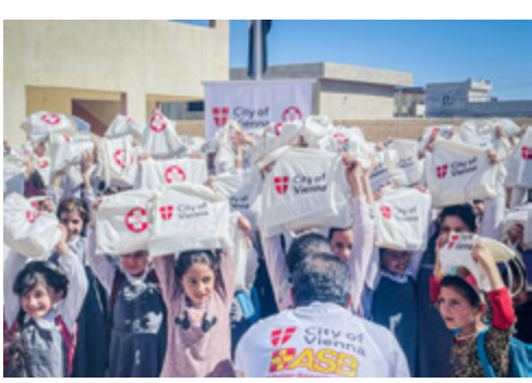
Die Schülerinnen erhalten Unterricht zu Hygienethemen.