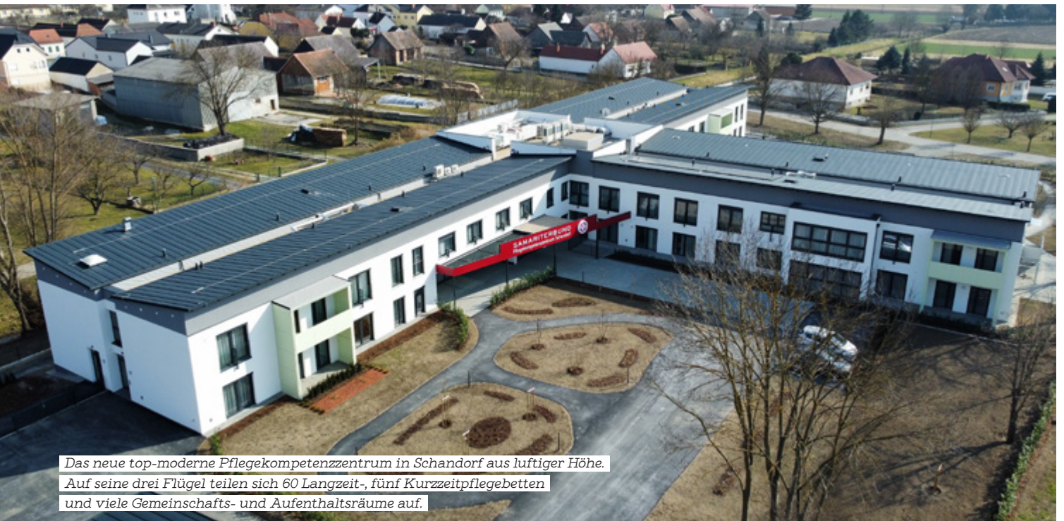
Das neue top-moderne Pflegekompetenzzentrum in Schandorf aus luftiger Höhe. Auf seine drei Flügel teilen sich 60 Langzeit-, fünf Kurzzeitpflegebetten und viele Gemeinschafts- und Aufenthaltsräume auf.

Einzigartig an dieser Einrichtung ist die Sprachenvielfalt, die in diesem Haus gelebt wird.