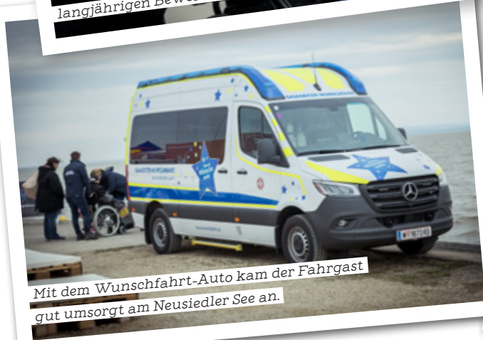
Mit dem Wunschfahrt-Auto kam der Fahrgast gut umsorgt am Neusiedler See an.