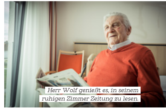
Herr Wolf genießt es, in seinem ruhigen Zimmer Zeitung zu lesen.