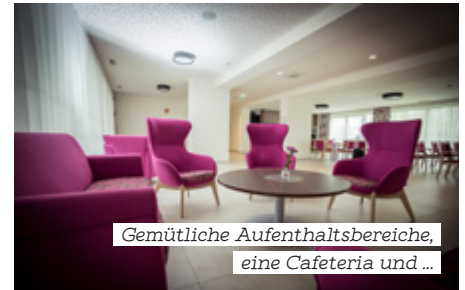
Gemütliche Aufenthaltsbereiche, eine Cafeteria und ...