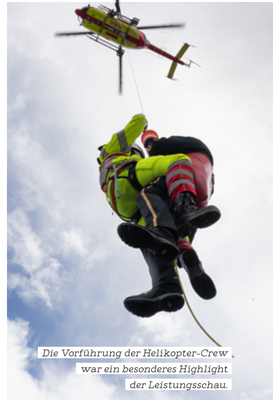
Die Vorführung der Helikopter-Crew war ein besonderes Highlight der Leistungsschau.

Einen markanten Anstieg gab es im Ausbildungsbereich: Waren anfänglich noch zehn bis 20 Kurse zu betreuen, so sind es nun jährlich mehr als 150. Rund 20.000 Personen sind in den verschiedensten Erste-Hilfe-Kursen geschult worden. Im Ausbildungszentrum konnten Rettungssanitäterkurse abgehalten und erstmals auch ein gemeinsamer Kurs für angehende Notfallsanitäter:innen von Sama-