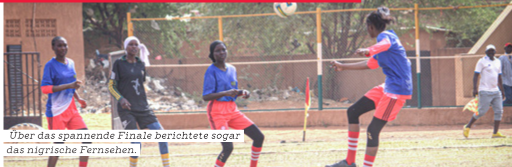
Über das spannende Finale berichtete sogar das nigrische Fernsehen.

Sport und speziell Fußball genießen im westafrikanischen Staat Niger hohen Stellenwert. Das Selbstbewusstsein junger Mädchen zu stärken, ihnen auch den Zugang zu Gesundheitseinrichtungen zu erleichtern – das ist das Ziel eines aktuellen Projekts des Samariterbundes, das vom hiesigen Sportministerium gefördert wird. Im Beisein hochrangiger Persönlichkeiten ging im März das erste Fußballturnier in Tahoua-Stadt, im mittleren