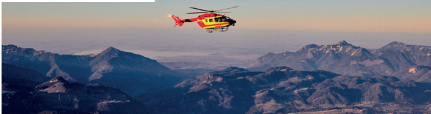
Die Kitz-Ambulance im Himmel über den Alpen: Der Flug von Rijeka nach Salzburg dauerte 90 Minuten.

Bei einer spektakulären Heli-Überstellung von Kroatien nach Österreich arbeiteten Samariter:innen aus Salzburg und Tirol zum Wohle des Patienten eng und reibungslos zusammen.