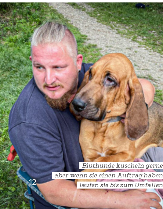
Bluthunde kuscheln gerne, aber wenn sie einen Auftrag haben, laufen sie bis zum Umfallen.