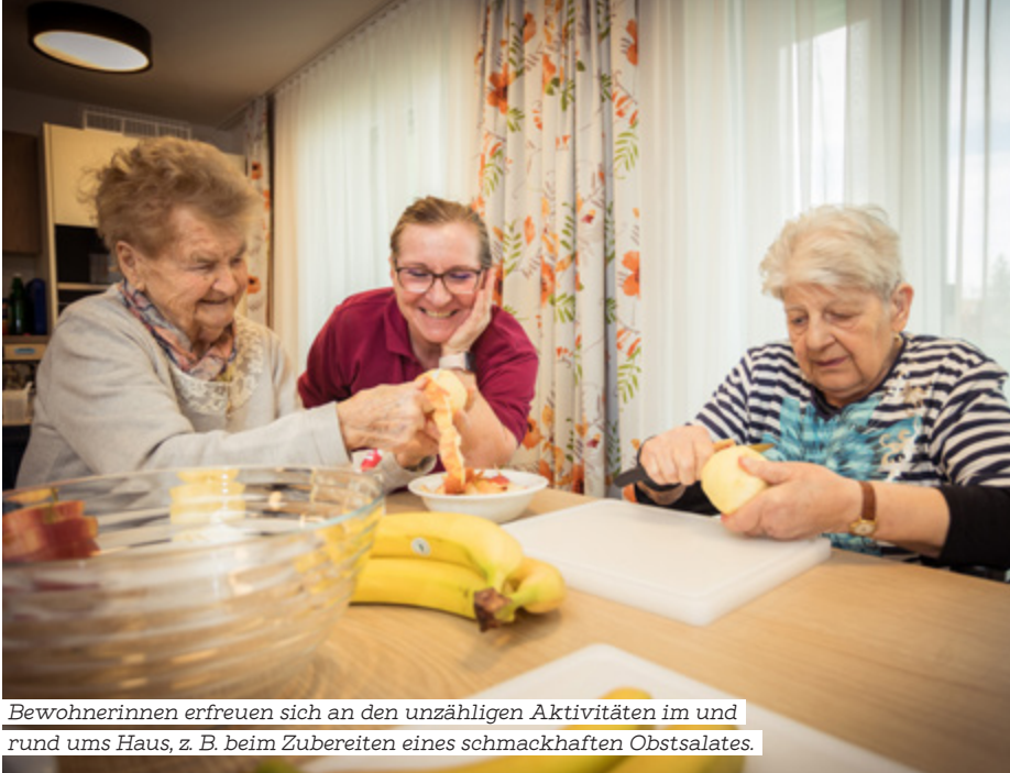
Bewohnerinnen erfreuen sich an den unzähligen Aktivitäten im und rund ums Haus, z. B. beim Zubereiten eines schmackhaften Obstsalates.