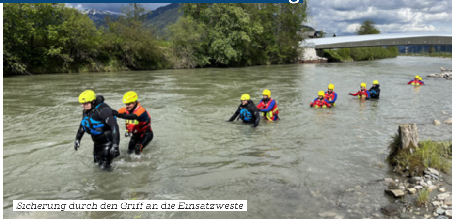
Sicherung durch den Griff an die Einsatzweste

Die Samariterbund-Wasserrettungen Zell am See, Linz und Floridsdorf-Donaustadt sowie die Berufsfeuerwehr Linz trainierten gemeinsam in Flüssen und Bächen. Inhalt der Praxis-Ausbildung waren u. a. die gesicherte Fortbewegung im Trupp durch direkte Sicherung oder Sicherung an der Leine, der Umgang mit dem Wurfsack, Seiltechnik und die Rettung durch Leinenschwimmer. Die theoretische Ausbildung umfasste Materialkunde