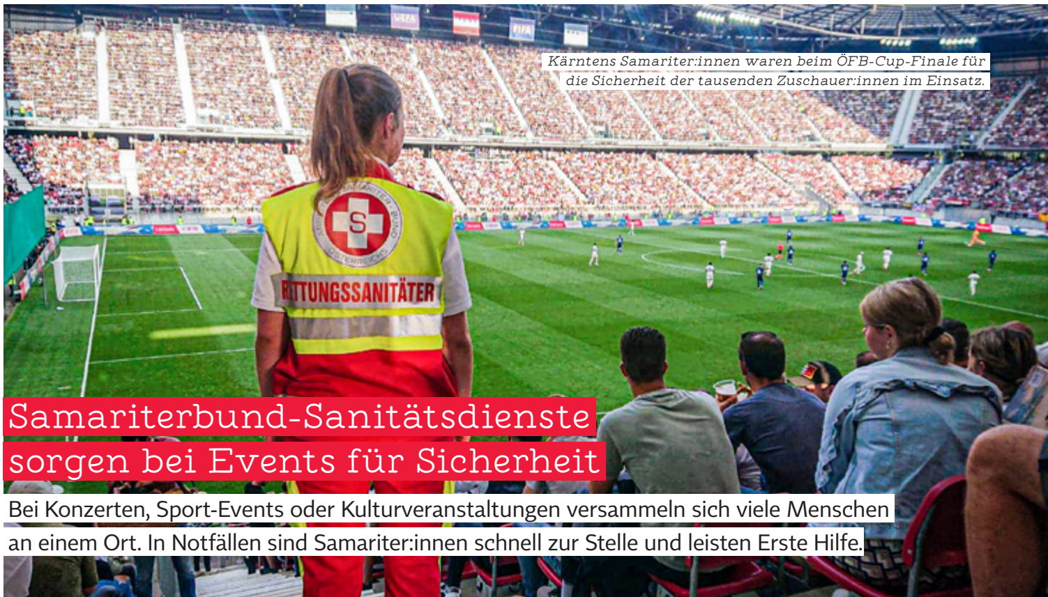
Kärntens Samariter:innen waren beim ÖFB-Cup-Finale für die Sicherheit der tausenden Zuschauer:innen im Einsatz.