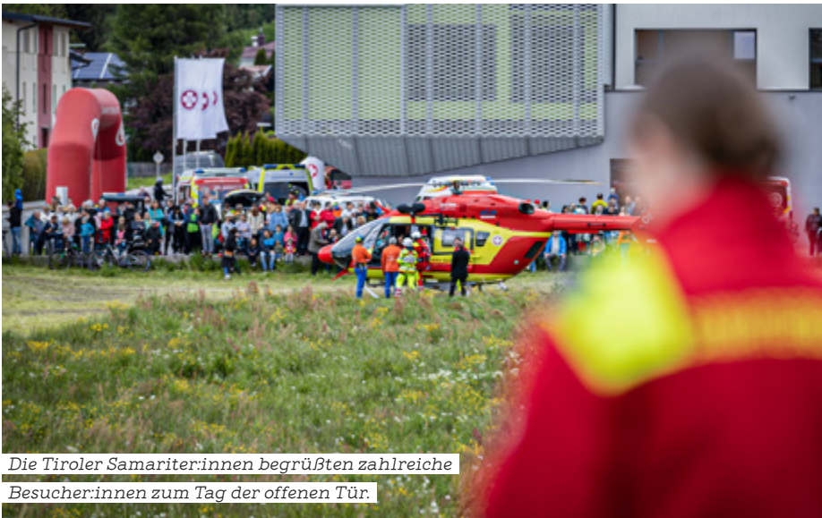
Die Tiroler Samariter:innen begrüßten zahlreiche Besucher:innen zum Tag der offenen Tür.

Gesundheitsstraße wurden zudem Gratis-Checks für Blutdruck und Blutzucker sowie Informationen zu Erste-Hilfe-Kursen geboten. Die jüngsten Gäste wiederum erfreuten sich am abwechslungsreichen Kinderprogramm.