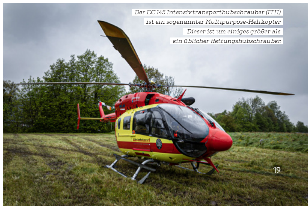
Der EC 145 Intensivtransporthubschrauber (ITH) ist ein sogenannter Multipurpose-Helikopter. Dieser ist um einiges größer als ein üblicher Rettungshubschrauber.