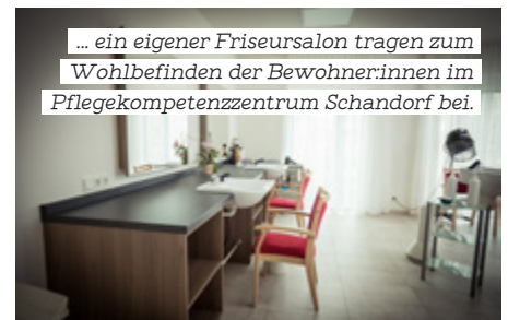
... ein eigener Friseursalon tragen zum Wohlbefinden der Bewohner:innen im Pflegekompetenzzentrum Schandorf bei.

Räumlichkeiten, Begegnungsorten und interdisziplinären Teams. Die Wohngruppe selbst ist das Zuhause mit eigenem Wohnraum, die zentral gelagerten allgemeinen Flächen sind der Treffpunkt für Bewohner:innen und Bevölkerung. Es werden in einer Wohngruppe 13 Bewohner:innen von Mitarbeiter:innen mit interprofessioneller Ausbildung betreut. Das Konzept rückt die Bedürfnisse der Bewohner:innen in den Fokus und richtet sich nach dem individuellen Pflegebedarf.