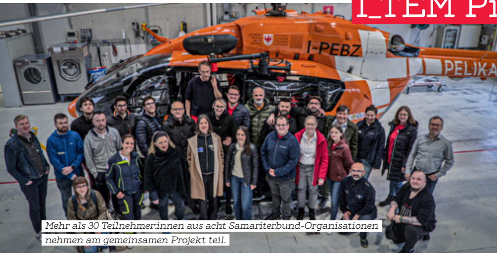
Mehr als 30 Teilnehmer:innen aus acht Samariterbund-Organisationen nehmen am gemeinsamen Projekt teil.