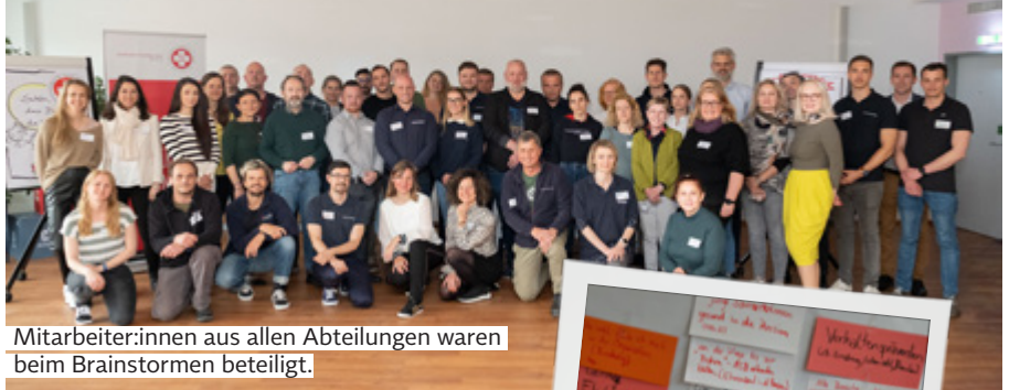
Mitarbeiter:innen aus allen Abteilungen waren beim Brainstormen beteiligt.

Welche Richtung schlägt der Samariterbund Wien in Zukunft beim Umweltschutz ein? Und wie soll die Gesundheitsvorsorge für die Mitarbeiter:innen aussehen? Diesen Fragen gingen knapp 50 Mitarbeiter:innen aus allen Abteilungen des Samariterbundes bei einem gemeinsamen Workshop nach. Das Ziel dabei: die Entwicklung eines neuen Nachhaltigkeitsleitbildes für Gesundheit und Ökologie im Landesverband. Der Weg dorthin: gemeinschaftliches Diskutieren in Kleingruppen zu Themen wie der Zukunft des Arbeitens oder auch der Verantwortung jeder und jedes Einzelnen für den Klimaschutz. „Umwelt und Gesundheit sind nicht voneinander zu trennen. Hier nach-