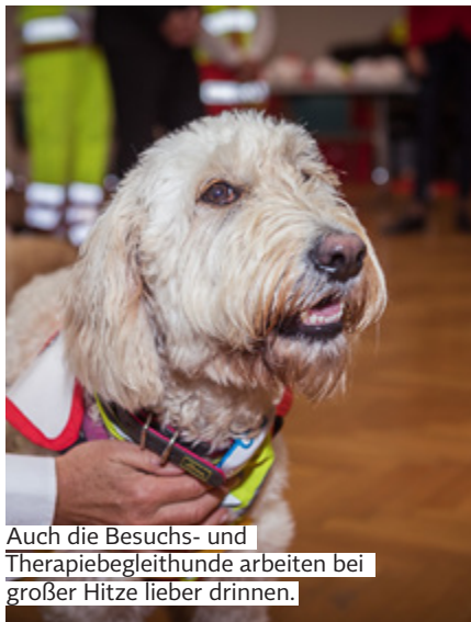
Auch die Besuchs- und Therapiebegleithunde arbeiten bei großer Hitze lieber drinnen.