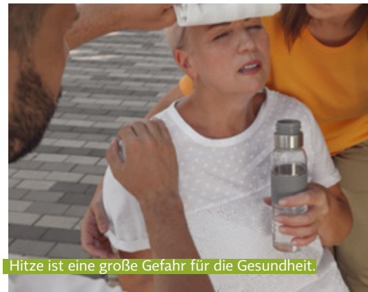
Hitze ist eine große Gefahr für die Gesundheit.