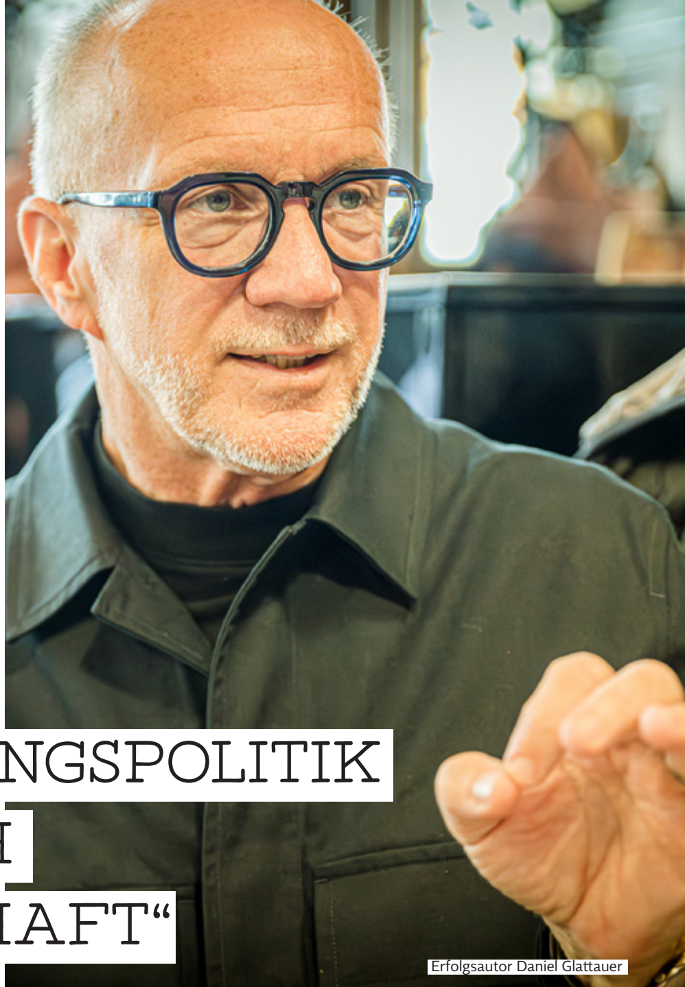
Erfolgsautor Daniel Glattauer

sam WIEN: Im Zentrum Ihres neuen Romans „Die spürst du nicht“ steht eine Flüchtlingsfamilie aus Somalia und der Umgang mit Flüchtlingen in einem Umfeld zweier Wiener Bobo-Familien. Was hat Sie dazu bewegt, dies zum Thema Ihres neuen Romans zu machen?