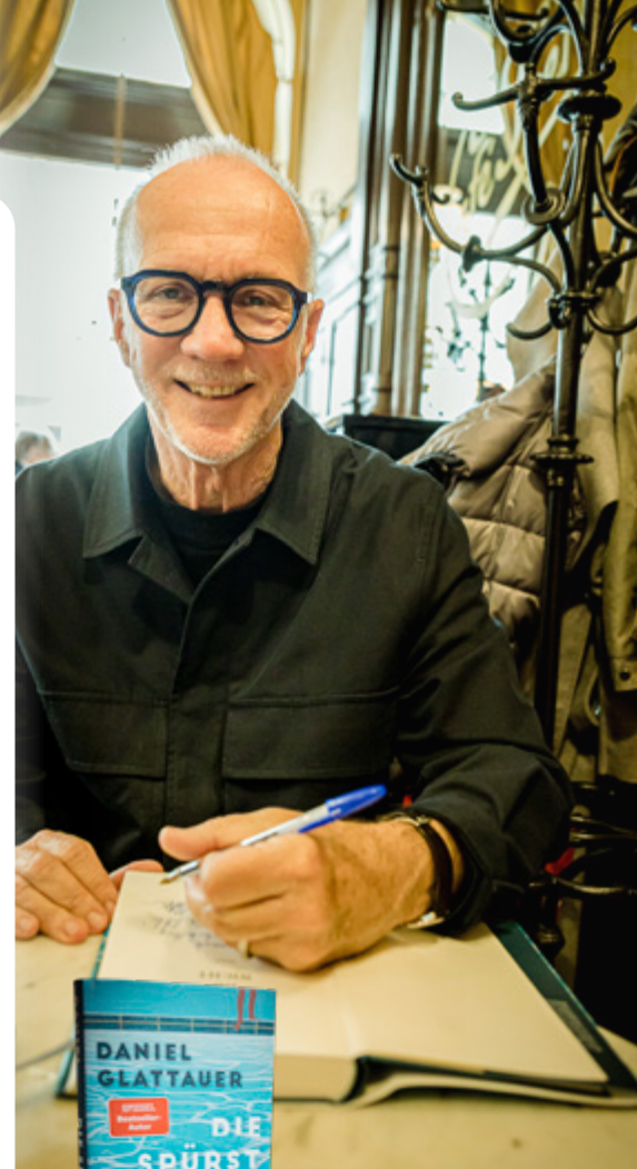
„Die spürst du nicht“ Zsolnay Verlag 304 Seiten ISBN: 978-3-552-07333-3