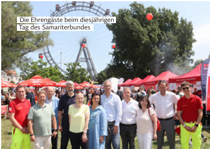
Die Ehrengäste beim diesjährigen Tag des Samariterbundes