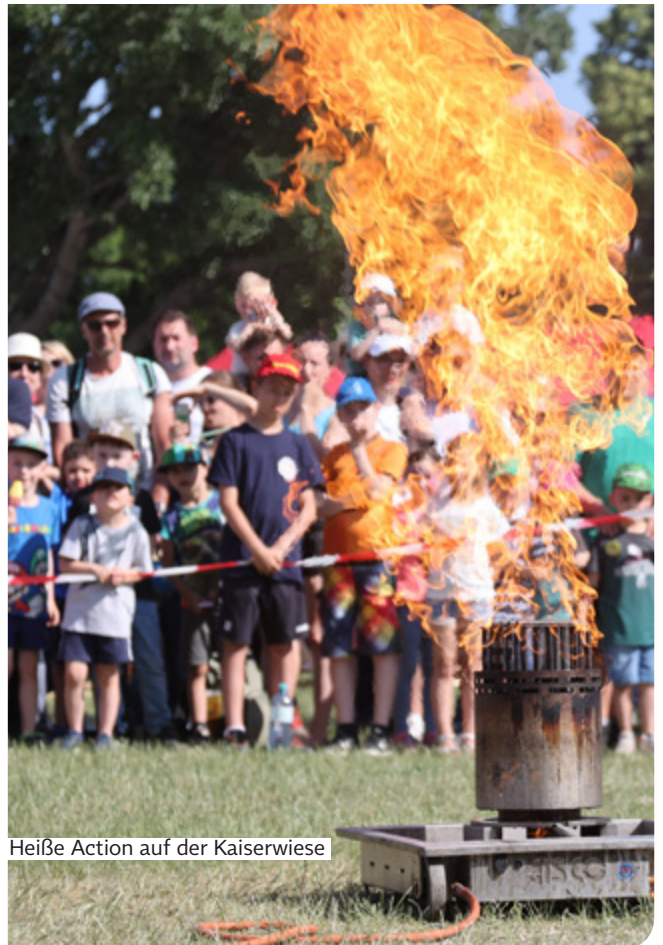
Heiße Action auf der Kaiserwiese