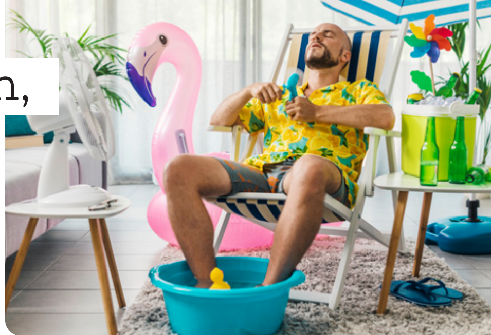
Die Hitze macht auch das Leben in den eigenen vier Wänden immer mühsamer.

heizt die Räume noch zusätzlich auf. Ausnahme: Wo sich Gasthermen befinden, sollten Fenster auch tagsüber geöffnet werden, um die Gefahr eines Kohlenmonoxid-Staus zu reduzieren.