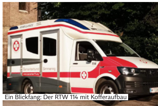
Ein Blickfang: Der RTW 114 mit Kofferaufbau