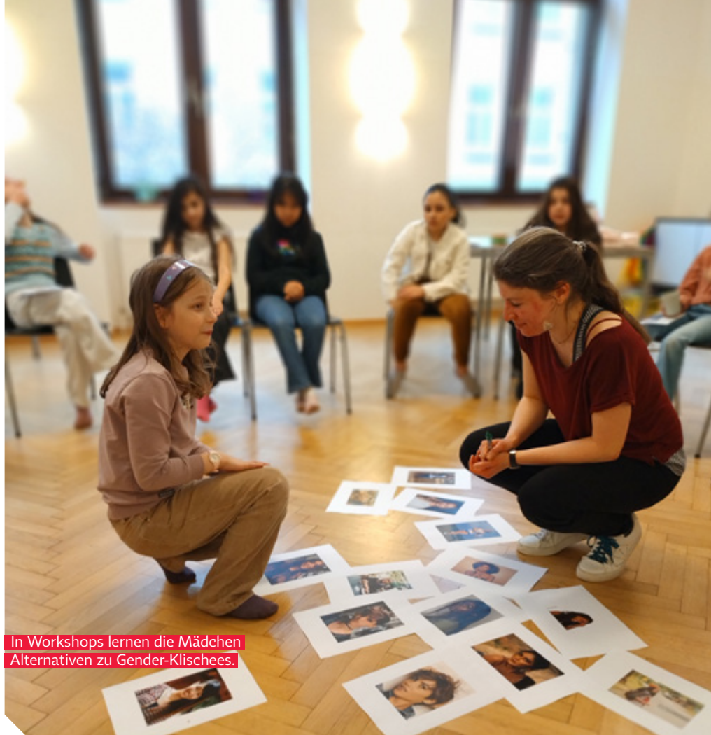
In Workshops lernen die Mädchen Alternativen zu Gender-Klischees.