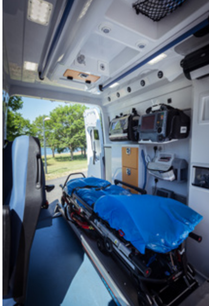
Auf 22°C temperierte Krankenwägen sorgen bei Sanitäter:innen für kühle Köpfe.

Wer keine Wohnung hat, ist so unmittelbar von der Klimakrise betroffen wie sonst wohl kaum jemand. Stürmen, Starkregen, aber eben auch Hitzestaus in der Stadt sind Wohnungslose schutzlos ausgeliefert – es sei denn, sie haben etwa in einer der Unterkünfte des Samariterbund Wiens Platz gefunden. Durch die Wärme hat sich dort, wie in anderen vergleichbaren Wohnungen auch, der Alltag verändert. Für Entlastung sorgen deswegen unter anderem