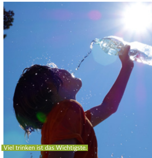
Viel trinken ist das Wichtigste.