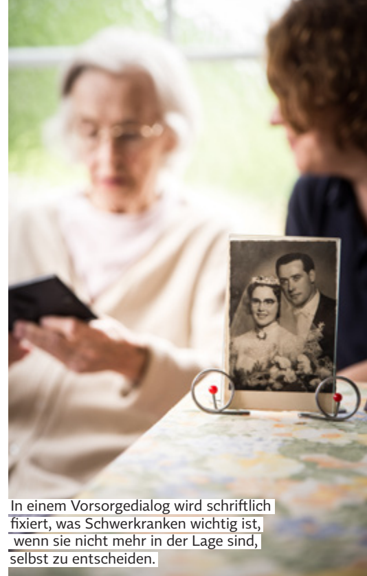
In einem Vorsorgedialog wird schriftlich fixiert, was Schwerkranken wichtig ist, wenn sie nicht mehr in der Lage sind, selbst zu entscheiden.