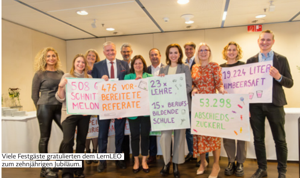
Viele Festgäste gratulierten dem LernLEO zum zehnjährigen Jubiläum.

„Jeder in das LernLEO investierte Euro schafft einen gesellschaftlichen Mehrwert von 22,09 Euro.“