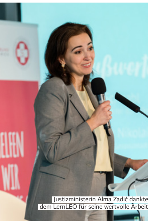
Justizministerin Alma Zadić dankte dem LernLEO für seine wertvolle Arbeit.