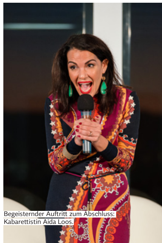
Begeisternder Auftritt zum Abschluss: Kabarettistin Aida Loos.