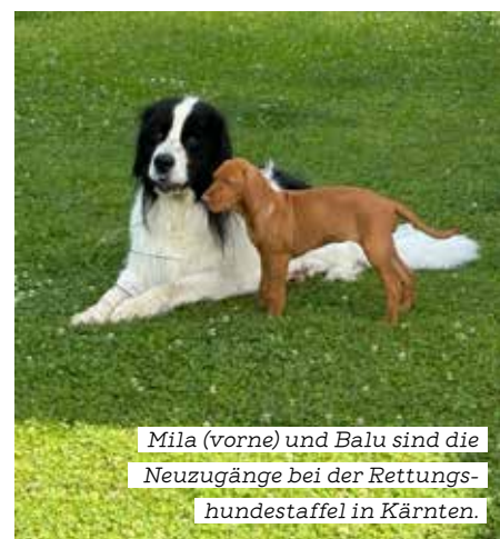
Mila (vorne) und Balu sind die Neuzugänge bei der Rettungshundestaffel in Kärnten.