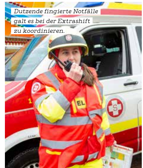
Dutzende fingierte Notfälle galt es bei der Extrashift zu koordinieren.