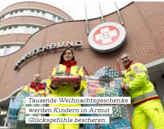
Tausende Weihnachtsgeschenke werden Kindern in Armut Glücksgefühle bescheren.

Bereits zum elften Mal fand 2023 die Initiative „Spielen Sie Christkind!“ statt. Zigtausende Österreicher:innen haben sich an der gemeinsamen Aktion von Samariterbund und der Österreichischen Post AG beteiligt und dabei