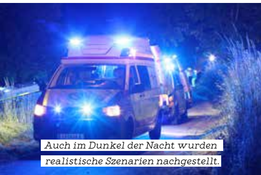
Auch im Dunkel der Nacht wurden realistische Szenarien nachgestellt.

ein Brand im Informationsgebäude des Linzer Jahrmarktgeländes, eine groß angelegte Suchaktion mit der Rettungshundstaffel Alkoven, ein Flugzeugabsturz in der Donau und die Rettung einer Person aus der Donau durch die Wasserrettung. Alles sehr spektakulär!