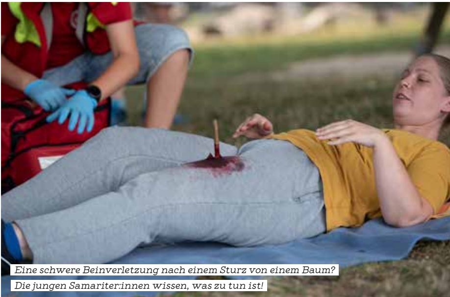
Eine schwere Beinverletzung nach einem Sturz von einem Baum? Die jungen Samariter:innen wissen, was zu tun ist!