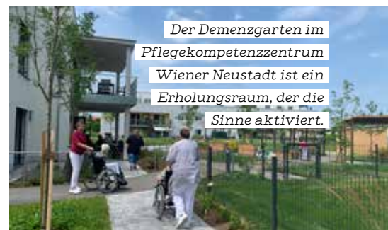
Der Demenzgarten im Pflegekompetenzzentrum Wiener Neustadt ist ein Erholungsraum, der die Sinne aktiviert.