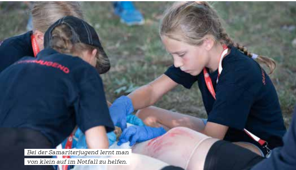
Bei der Samariterjugend lernt man von klein auf im Notfall zu helfen.