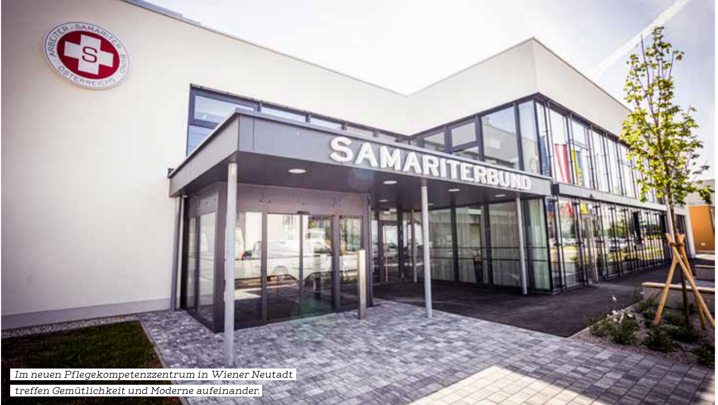
Im neuen Pflegekompetenzzentrum in Wiener Neustadt treffen Gemütlichkeit und Moderne aufeinander.