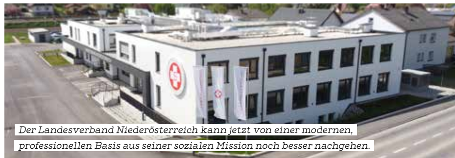
Der Landesverband Niederösterreich kann jetzt von einer modernen, professionellen Basis aus seiner sozialen Mission noch besser nachgehen.