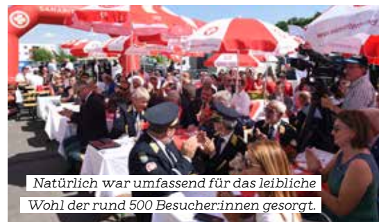
Natürlich war umfassend für das leibliche Wohl der rund 500 Besucher:innen gesorgt.

Selbstverständlich gab es die Möglichkeit, die Landeszentrale sowie die Rettungsschule mit ihrem einzigartigen Simulationsraum ausgiebig zu besichtigen. Weiters zeigte der Samariterbund in einer Leistungsschau seine vielfältigen Aufgabenbereiche – vom Rettungsdienst über Jugendarbeit und Wunschfahrt bis zur Rettungshundestaffel, die mehrere Vorführungen abhielt. Außerdem waren