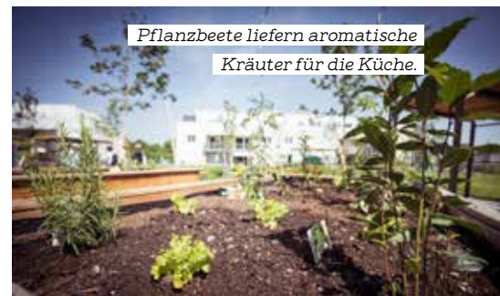
Pflanzbeete liefern aromatische Kräuter für die Küche.