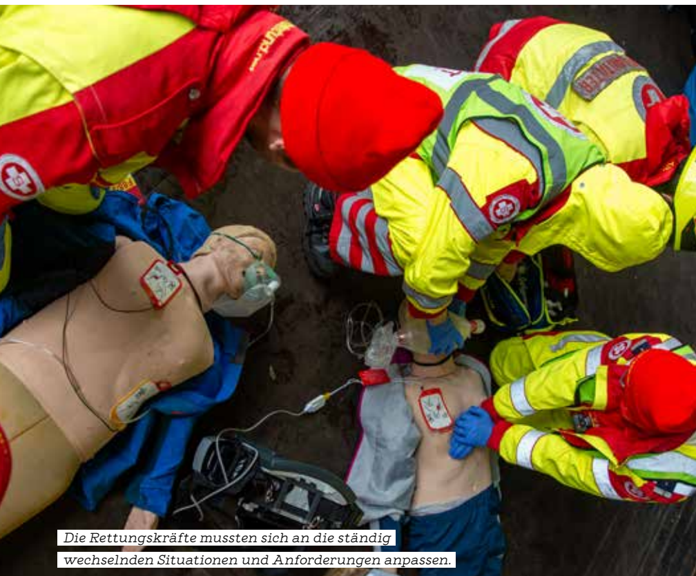
Die Rettungskräfte mussten sich an die ständig wechselnden Situationen und Anforderungen anpassen.

Auch eine zusätzliche „Extrashift“ gab es im heurigen Jahr. Die Großübung nahm die rund 60 Teilnehmer:innen des ASB Kärnten, Alkoven, Feldkirchen und Linz drei Tage und Nächte (19. bis 21. April 2024) in Anspruch. 28 größere und kleinere Einzelszenarien verlangten ein ständiges Anpassen der Rettungskräfte an neue Situationen, da aufgrund einer simulierten Katastrophe und des real schlechten Wetters Teile des Einsatzbereichs nur schwer zugänglich waren. Zu den Höhepunkten zählten jedenfalls