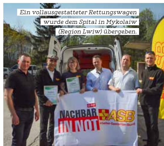
Ein vollausgestatteter Rettungswagen wurde dem Spital in Mykolaiw (Region Lwiw) übergeben.