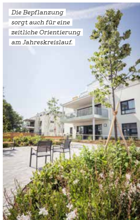
Die Bepflanzung sorgt auch für eine zeitliche Orientierung am Jahreskreislauf.

tenschutz und Umweltschutz beitragen.“ Grundsätzlich gilt: Die Pflegearbeiten in den Grünanlagen sollten sich nicht zu aufwendig gestalten, und bei der Pflanzung von Bäumen sollte klimafit-ten Arten der Vorzug gegeben werden, die auch bald guten natürlichen Schatten spenden. „Wichtig ist es auch, dem Wildwuchs Platz zu geben und Nützlingsunterkünfte zu schaffen sowie keine chemisch-synthetischen Dünger oder Pflanzenschutzmittel zu verwenden“, resümiert Brigitta Hemmelmeier-Händel.