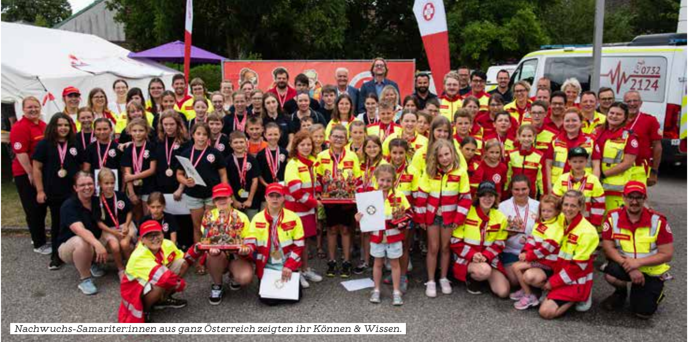
Nachwuchs-Samariter:innen aus ganz Österreich zeigten ihr Können & Wissen.