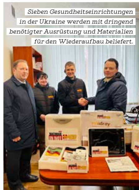
Sieben Gesundheitseinrichtungen in der Ukraine werden mit dringend benötigter Ausrüstung und Materialien für den Wiederaufbau beliefert.