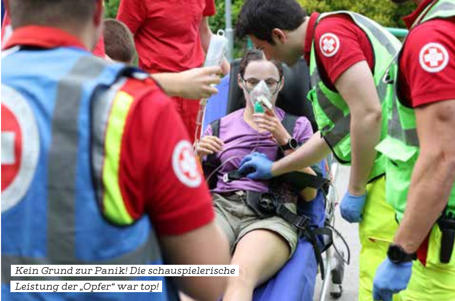
Kein Grund zur Panik! Die schauspielerische Leistung der „Opfer“ war top!