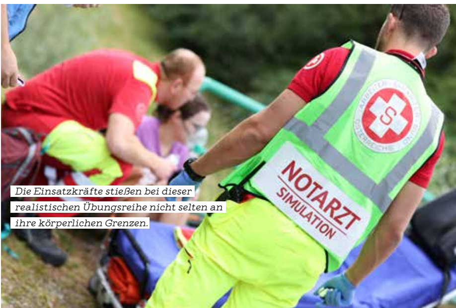
Die Einsatzkräfte stießen bei dieser realistischen Übungsreihe nicht selten an ihre körperlichen Grenzen.

Am 28. September 2024 findet die „Dayshift 5“ statt, die mit dem 111. Szenario beendet sein wird. Da die Ressourcen immer wieder ein Thema sind, wird sich erst zeigen, ob im Jahr 2025 eine weitere „Shift“ stattfinden kann. ●