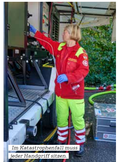
Im Katastrophenfall muss jeder Handgriff sitzen.