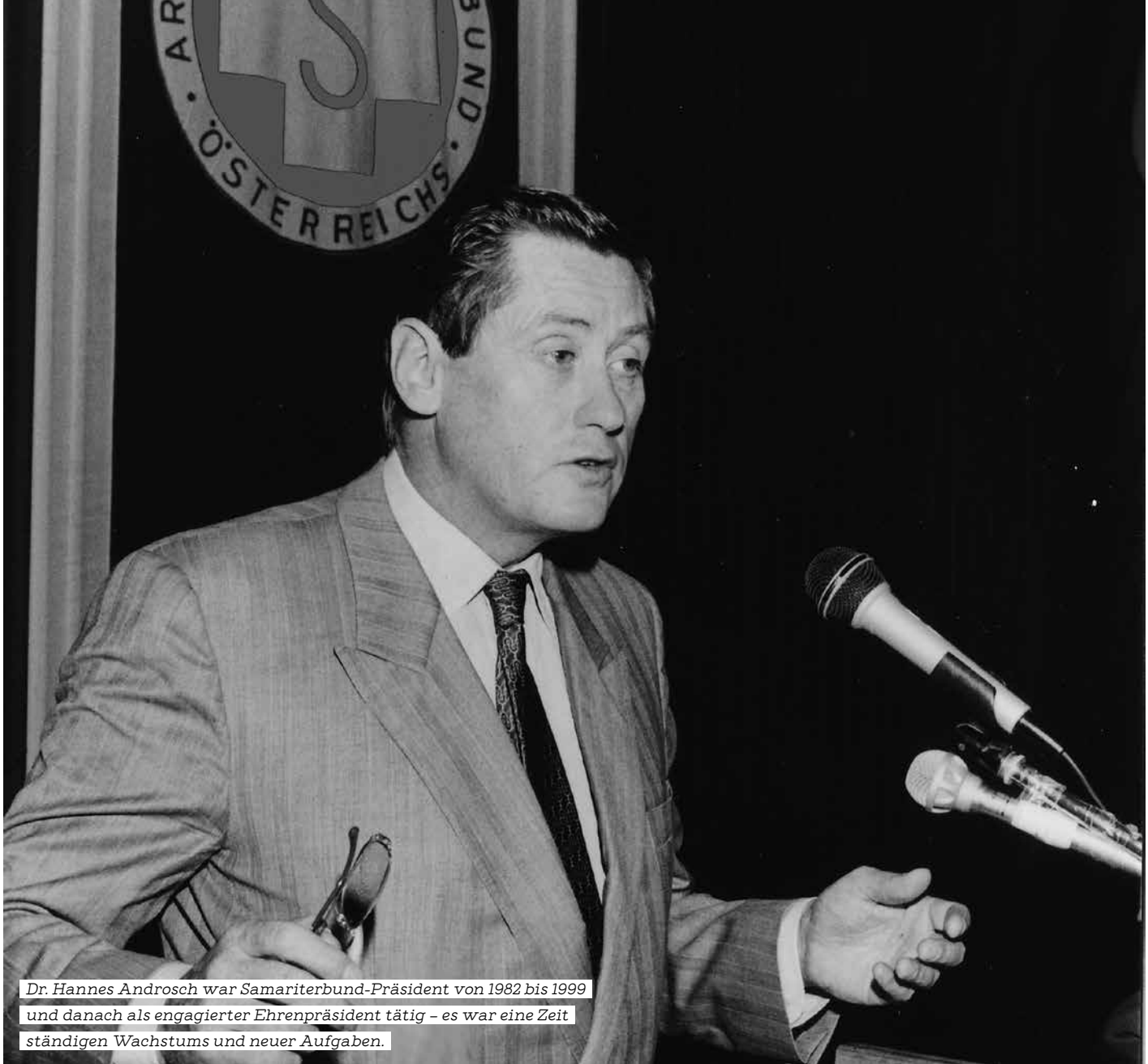
Dr. Hannes Androsch war Samariterbund-Präsident von 1982 bis 1999 und danach als engagierter Ehrenpräsident tätig – es war eine Zeit ständigen Wachstums und neuer Aufgaben.