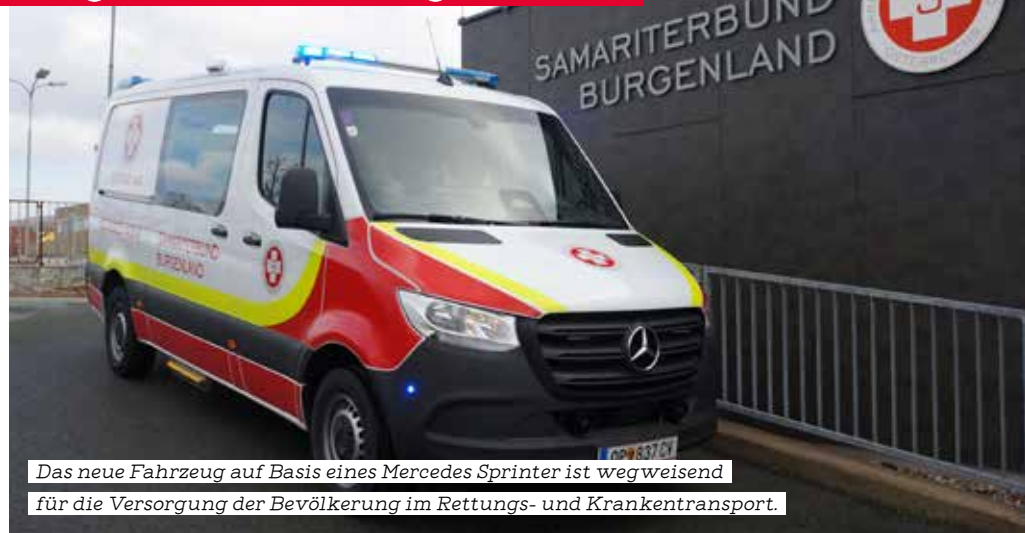
Das neue Fahrzeug auf Basis eines Mercedes Sprinter ist wegweisend für die Versorgung der Bevölkerung im Rettungs- und Krankentransport.

„Bei der Gestaltung des Patientenraums und der Innenausstattung seitens der Firma Dlouhy konnten unsere Mitarbeiterinnen und Mitarbeiter ihre Erfahrungen aus ihrer täglichen Arbeit einfließen lassen. So wurden optimale Lösungen gefunden, die richtungs-