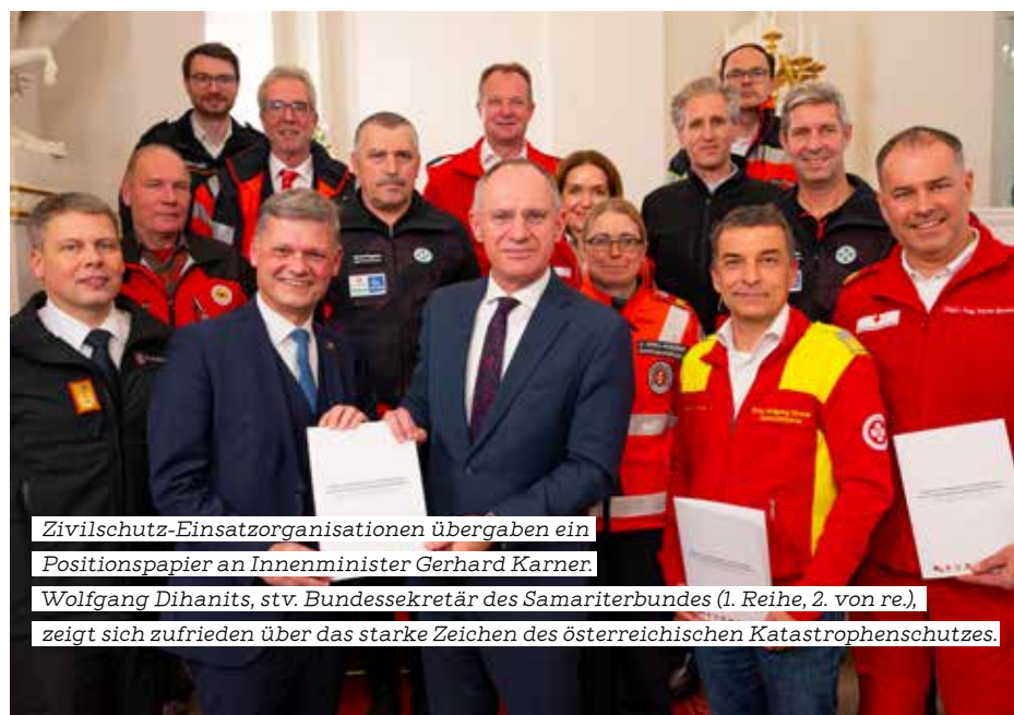
Zivilschutz-Einsatzorganisationen übergaben ein Positionspapier an Innenminister Gerhard Karner.