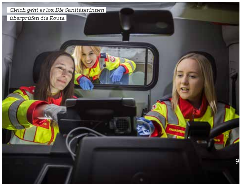
Gleich geht es los: Die Sanitäterinnen überprüfen die Route.