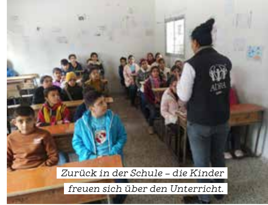
Zurück in der Schule – die Kinder freuen sich über den Unterricht.

Die Ali-Dayoub-Schule in Latakia wurde als einzige Grundschule des Dorfes Al Howaiz saniert. „In den sechs Monaten ihrer Schließung wurde die Schule wieder funktionstüchtig gemacht. Die