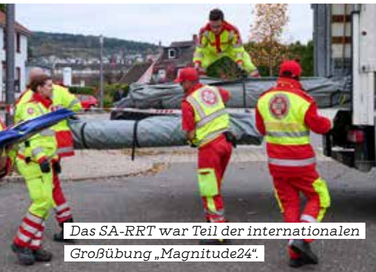
Das SA-RRT war Teil der internationalen Großübung „Magnitude24“.

Von 24. bis 26. Oktober 2024 fand in Baden-Württemberg die bisher größte EU-Katastrophenschutzübung auf deutschem Boden statt. Einsatzkräfte aus Deutschland, Österreich, Frankreich, Griechenland sowie der Schweiz trainierten in einem fiktiven Erdbebenszenario die grenzüberschreitende Zusammenarbeit – ein Schlüssel zum Erfolg im Ernstfall.