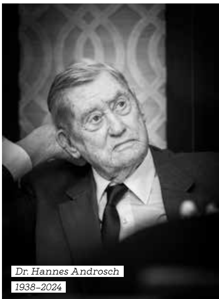
Dr. Hannes Androsch 1938–2024