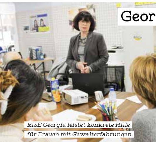
RISE Georgia leistet konkrete Hilfe für Frauen mit Gewalterfahrungen.

Die Gleichstellung und Selbstermächtigung von Frauen zu fördern – diese Ziele verfolgt ein Projekt des Samariterbundes in Westgeorgien, das seit 1. Oktober 2024 läuft. Kooperationspartner vor Ort ist das Länderbüro Georgien des Arbeiter-Samariter-Bund-Deutschlands, Fördergeber ist das österreichische Bundesministerium für Soziales, Gesundheit, Pflege und Konsumentenschutz.