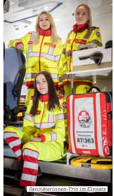
Sanitäterinnen-Trio im Einsatz