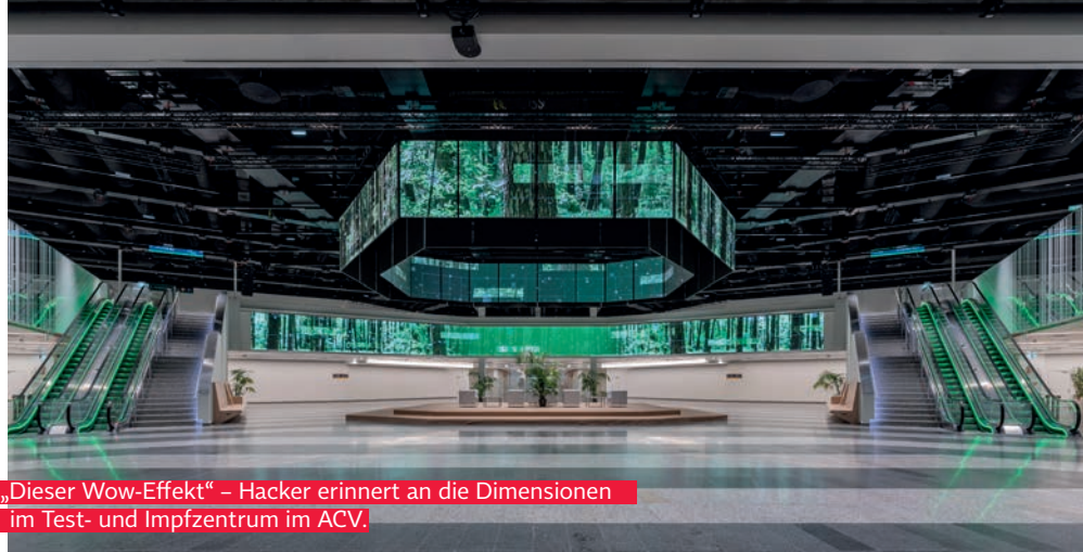
„Dieser Wow-Effekt“ – Hacker erinnert an die Dimensionen im Test- und Impfzentrum im ACV.

Bei den Spitälern haben wir die erste Etappe des Wiener Spitalskonzepts – weniger Klinikstandorte, Verbesserung der medizinischen Leistung durch Bildung von Kompetenzzentren – ab-