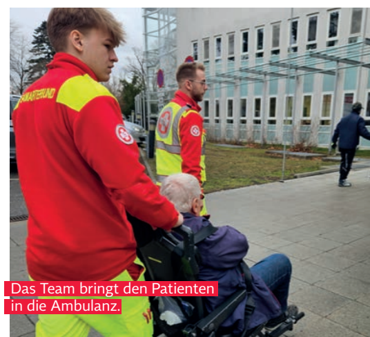
Das Team bringt den Patienten in die Ambulanz.