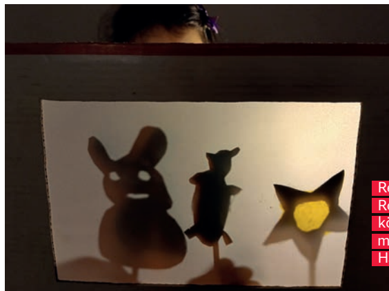
Reflexion dank Schatten- oder Rollenspiels: Die Teilnehmer:innen können ihre persönlichen Erfahrungen mit einbringen und so alternative Handlungsmöglichkeiten kennenlernen.