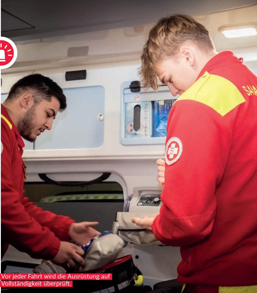
Vor jeder Fahrt wird die Ausrüstung auf Vollständigkeit überprüft.