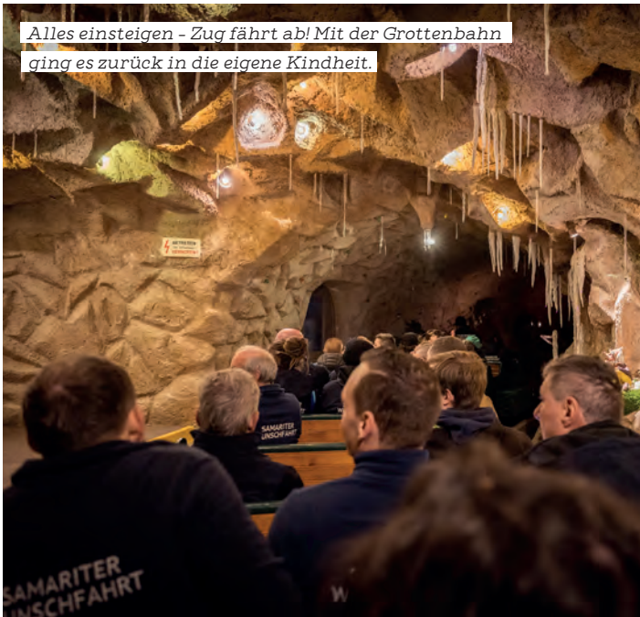
Alles einsteigen – Zug fährt ab! Mit der Grottenbahn ging es zurück in die eigene Kindheit.