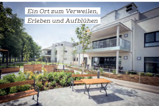
Ein Ort zum Verweilen, Erleben und Aufblühen

In den Pflegekompetenzzentren des Samariterbundes wird Nachhaltigkeit aktiv gelebt – mit biodiversen Oasen, Demenz-Gärten und klimafreundlicher Energiegewinnung.