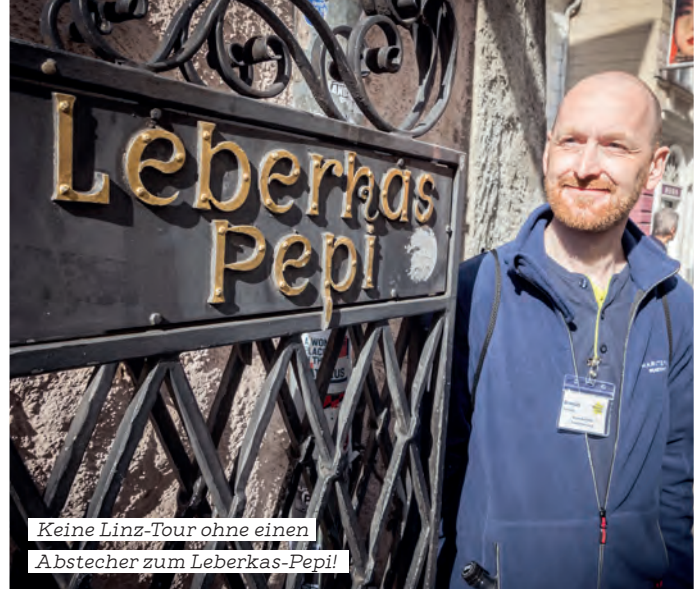
Keine Linz-Tour ohne einen Abstecher zum Leberkas-Pepi!

sonderes Highlight: Wer wollte, durfte selbst kurz das Steuer der Grottenbahn übernehmen und den vielbegehrten „Drachenführerschein“ ablegen. Ein märchenhaftes Vergnügen mit Erinnerungswert.