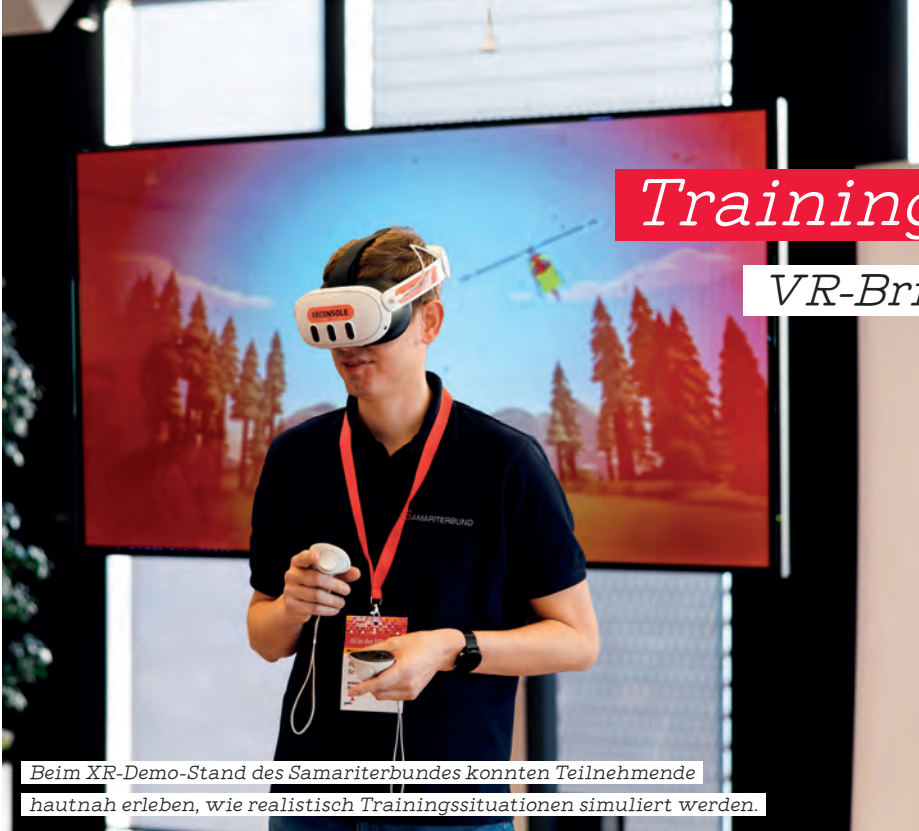
Beim XR-Demo-Stand des Samariterbundes konnten Teilnehmende hautnah erleben, wie realistisch Trainingssituationen simuliert werden.