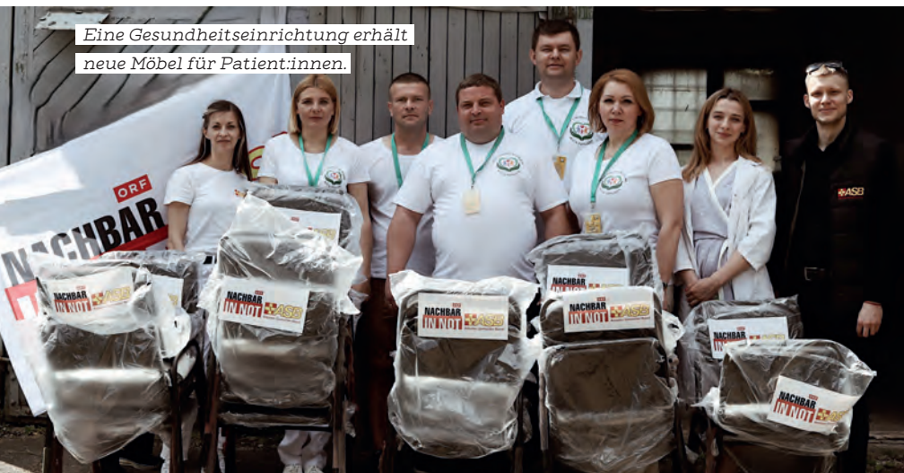
Eine Gesundheitseinrichtung erhält neue Möbel für Patient:innen.