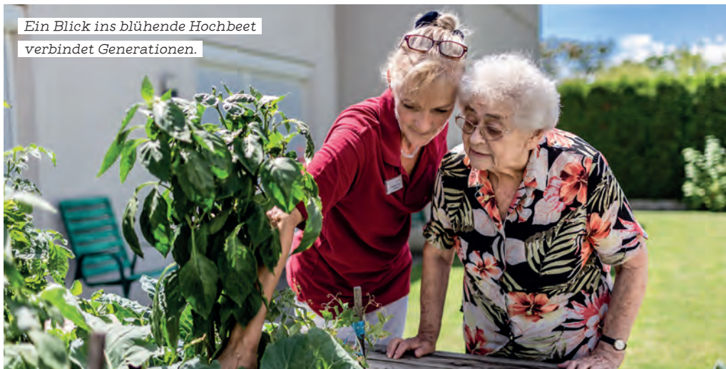
Ein Blick ins blühende Hochbeet verbindet Generationen.

Der Samariterbund setzt ein starkes Zeichen für gelebte Nachhaltigkeit und ein Miteinander, das Mensch und Natur in den Mittelpunkt stellt. In den Einrichtungen entstehen grüne Wohlfühloasen, die nicht nur der Umwelt, sondern auch den Bewohner:innen und Mitarbeitenden guttun.