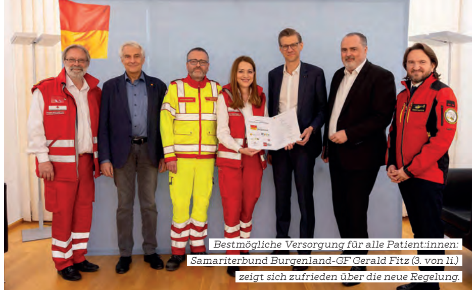
Bestmögliche Versorgung für alle Patient:innen:

Künftig wird die Zuteilung der Rettungstransporte auf Grund der fachlichen Zuständigkeit der fünf Spitäler im