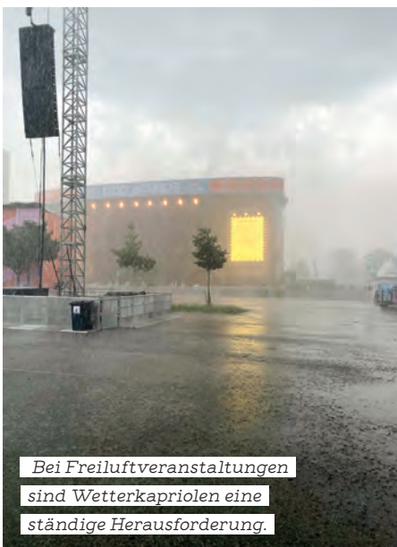
Bei Freiluftveranstaltungen sind Wetterkapriolen eine ständige Herausforderung.