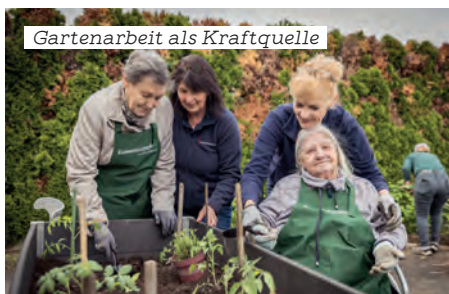
Gartenarbeit als Kraftquelle