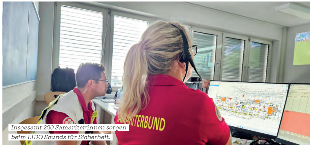
Insgesamt 200 Samariter:innen sorgen beim LIDO Sounds für Sicherheit.

Das LIDO Sounds findet auf einem asphaltierten Gelände statt, Hitze ist daher eine besondere Herausforderung: „Unsere Teams arbeiten im Schichtbetrieb, achten auf Pausen und ausreichend Flüssigkeit. Sonnencreme und Kappen gehören zur Grundausrüstung“, erklärt dazu Gruber. Eine wichtige Lehre aus dem Vorjahr: Zeltambulanzen brauchen bei großer Hitze eine Klimatisierung. Damals wurden kurzfristig Geräte organisiert – heuer ist man besser gerüstet. Mit neuen Heiz-, Kühl- und Lüftungsaggregaten wird eine professionelle Temperierung der Sanitätszelte von Anfang an sichergestellt.