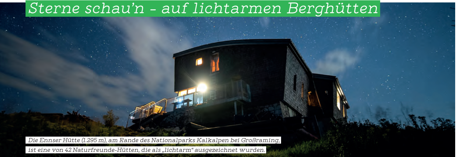
Die Ennser Hütte (1.295 m), am Rande des Nationalparks Kalkalpen bei Großbraming, ist eine von 42 Naturfreunde-Hütten, die als „lichtarm“ ausgezeichnet wurden.

Künstliches Licht erhellt unsere Nächte immer stärker. Die sogenannte Lichtverschmutzung hat weitreichende Folgen – für Tiere, Pflanzen und auch für uns Menschen. Gleichzeitig verschwinden die dunklen Rückzugsorte, an denen der Nachthimmel noch in seiner ganzen Pracht zu sehen ist. Orte, an denen die Milchstraße sichtbar wird, sind selten geworden.