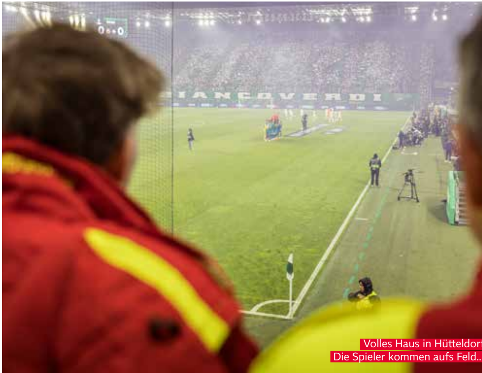
Volles Haus in Hütteldorf. Die Spieler kommen aufs Feld....

längst auf ihren Positionen, teilweise sichtbar für das Publikum – auf den Tribünen und am Spielfeldrand. Teilweise auch „unsichtbar“ in den Ambulanz-Räumlichkeiten innerhalb des Stadions oder in der Hauptambulanz außerhalb.