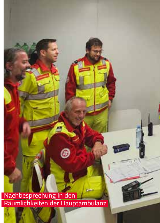
Nachbesprechung in den Räumlichkeiten der Hauptambulanz