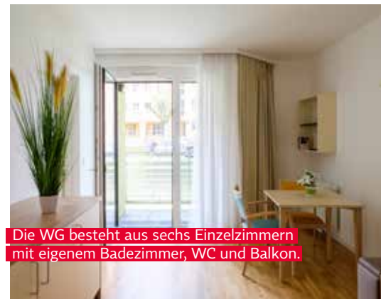
Die WG besteht aus sechs Einzelzimmern mit eigenem Badezimmer, WC und Balkon.

„Ich bin ein Mensch, der nicht bespaßt werden muss. Ich meide die Gesellschaft anderer nicht, aber ich bin auch nicht auf sie unbedingt angewiesen.“