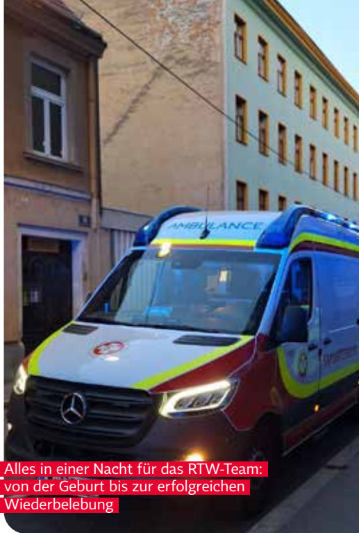
Alles in einer Nacht für das RTW-Team: von der Geburt bis zur erfolgreichen Wiederbelebung